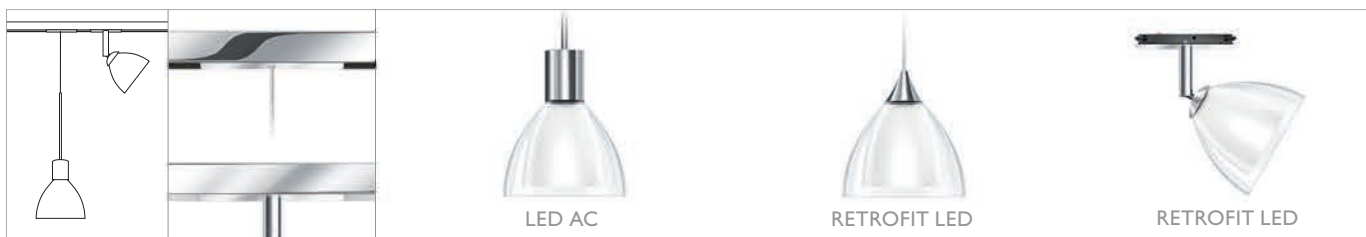
SILVA 110 SPOT G9 ALL-IN