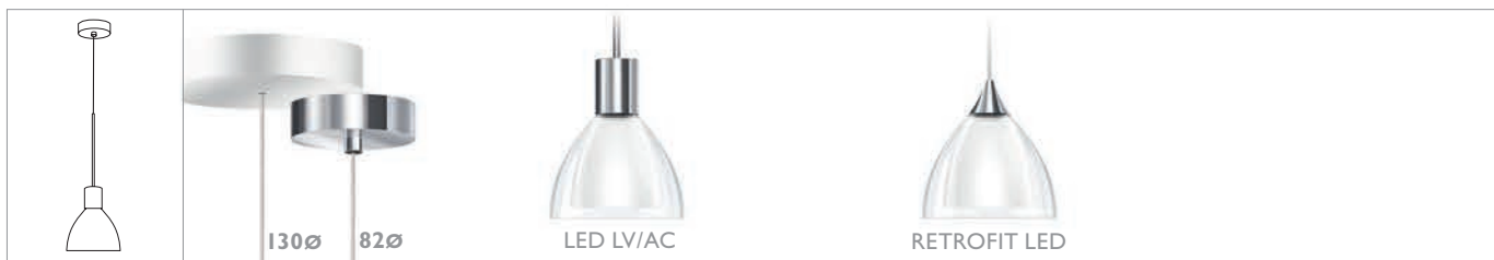
SILVA 110 G9 S