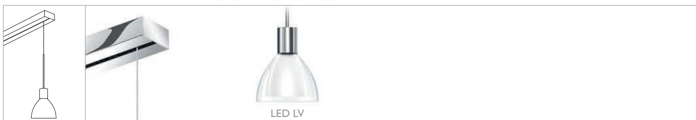
SILVA NEO 110 LV OE