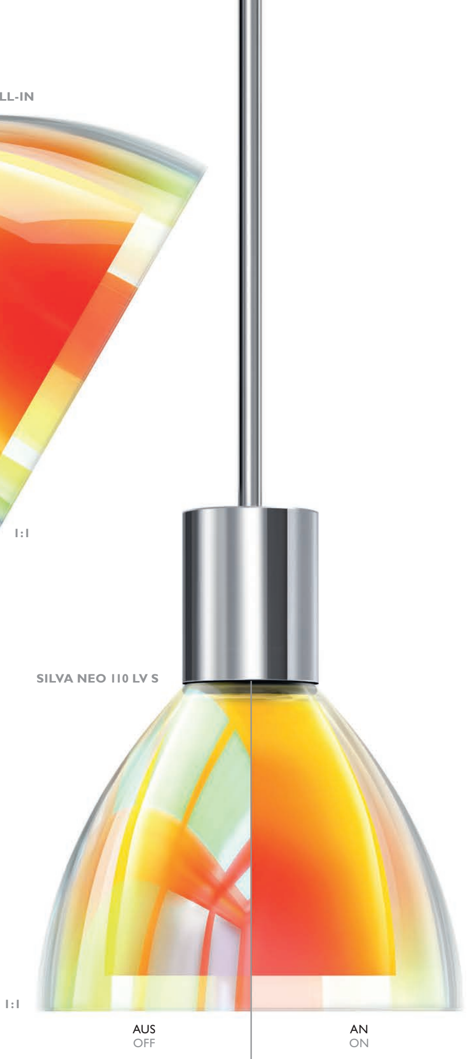
SILVA NEO 110 LV S