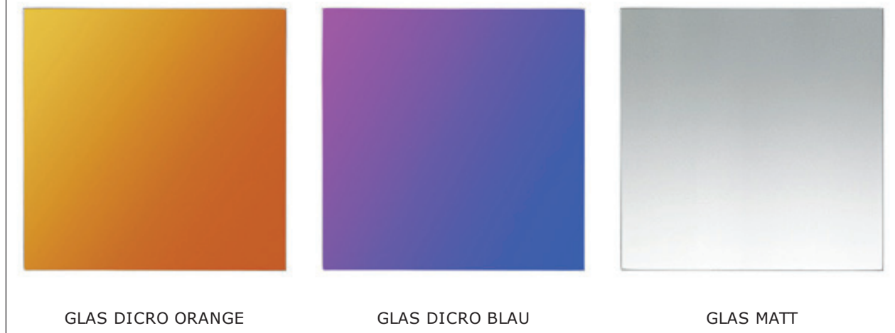
GLAS DICRO ORANGE

Dieses Produkt kann durch ein reichhaltig erhältliches Programm an Ausstattungsteilen, an Ihre persönlichen Bedürfnisse, angepasst werden. Finden Sie hier Ihren zuständigen Fachhändler...> Fachhändlersuche