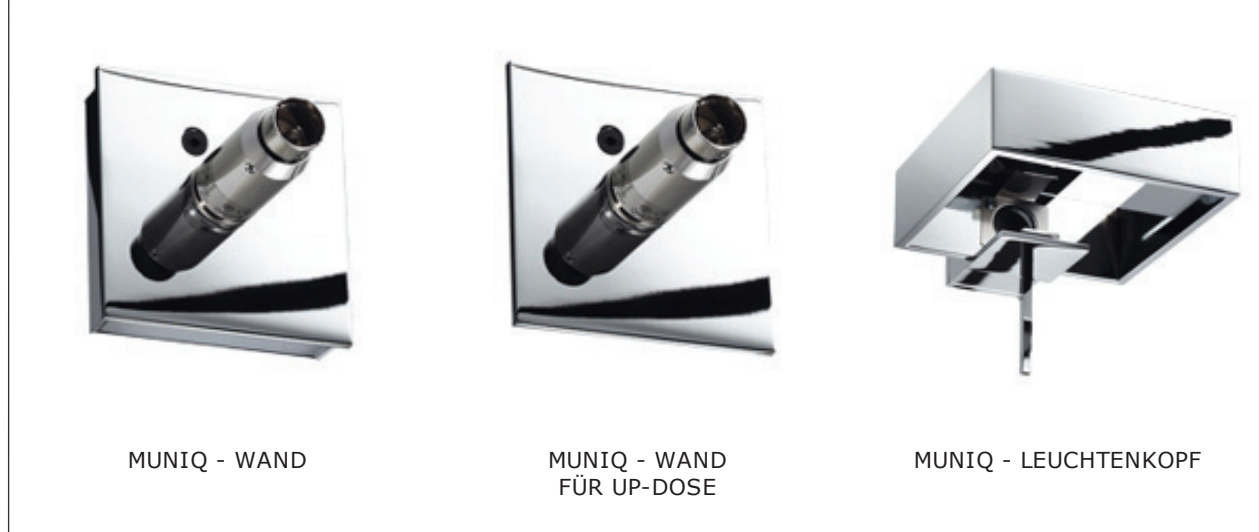
MUNIQ - WAND